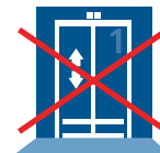
5. Keine Aufzüge benutzen

Können Räume nicht mehr verlassen werden, die Türen schließen und alle brennbaren Materialien von den Fenstern bemerkbar machen und auf Rettung durch die Feuerwehr warten.