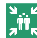
6. Sammelstelle aufsuchen