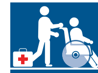
2. Hilflöse Personen mitnehmen und Erste Hilfe leisten