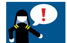
7. Auf Anweisungen achten